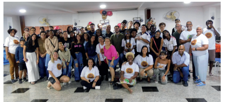
Aula Inaugural do Pré-Vestibular Comunitário Ganga Zumba 2026 (27 de fevereiro)

*Coordenadora-geral do Pré-Vestibular Comunitário Ganga Zumba desde 1998 e presidente do Instituto Ganga Zumba desde 2011.