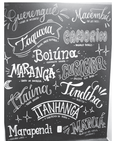
Painel da Casa de Cultura de Jacarepaguá

destaque. Uma das praças mais "abandonadas" da localidade está recebendo a Clínica da Família e sendo revitalizada com sessões de cinema inflável e feiras com música ao vivo. O projeto "Cultura e Saberes na Praça" acontece um domingo por mês e é uma ótima opção para curtir o dia em família.