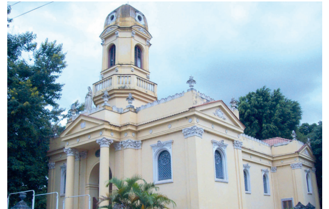
Igreja de Nossa Senhora dos Remédios - Núcleo Histórico Rodrigues Caldas