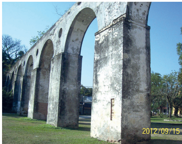
Aqueduto - Núcleo Histórico Rodrigues Caldas

Janeiro ocorreu no final dos anos 1970. Tornado lei pela Câmara dos Vereadores em 1983, ele visava proteger o patrimônio histórico e arquitetônico do Centro da cidade, combatendo demolições e incentivando a revitalização de diversos edifícios.