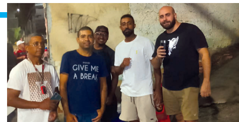
A galera da Equipe Estilo de Vida belo trabalho.

Fui convidada a conhecer essa forma de entretenimento que vem conquistando as ruas há algum tempo, e deixo aqui meus agradecimentos, em nome do JAAJ, pela autorização para fotografar e divulgar um pouco desse